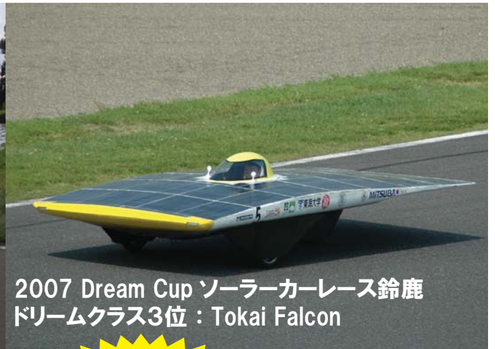
2007 Dream Cup ソーラーカーレース鈴鹿 ドリームクラス3位：Tokai Falcon