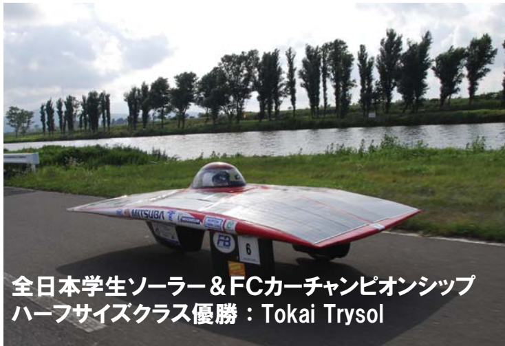
全日本学生ソーラー&FCカーチャンピオンシップ ハーフサイズクラス優勝：Tokai Trysol